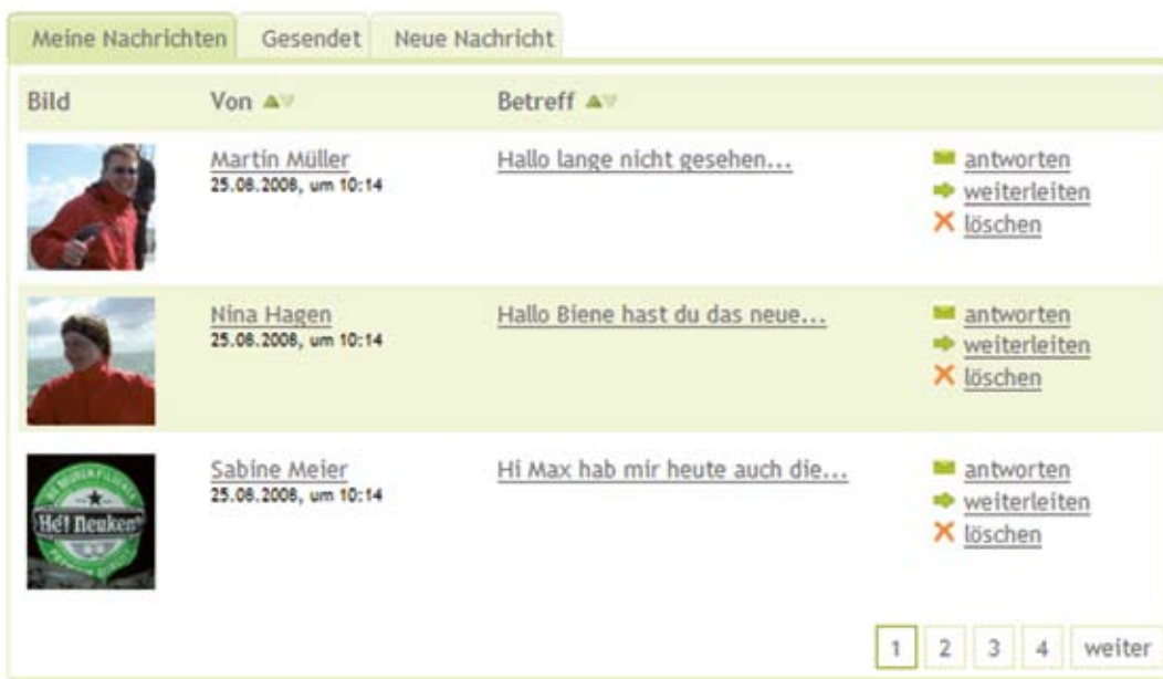
Nachrichtensystem in der Übersicht