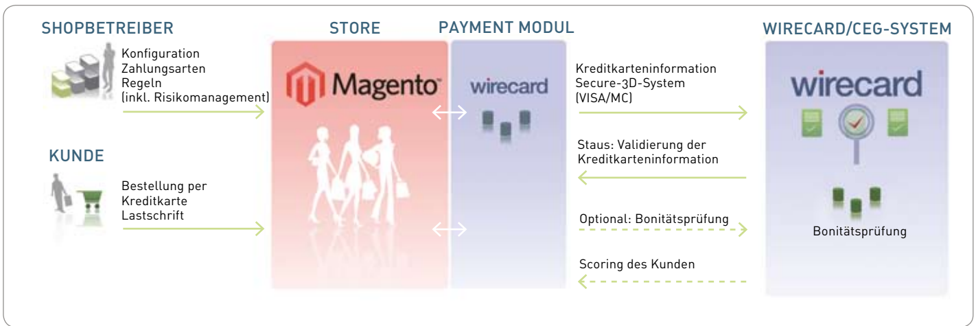
dotSource Magento Payment-Modul Wirecard